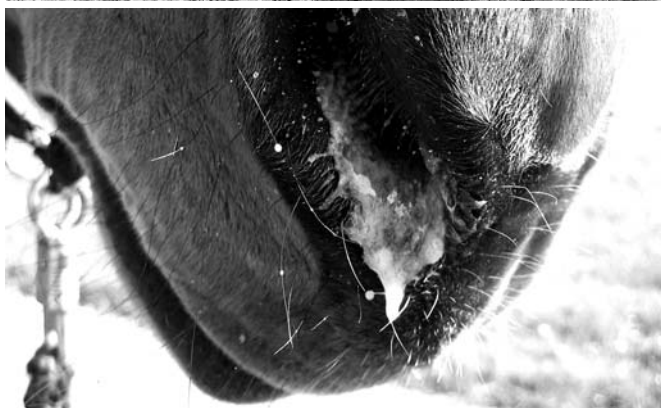
Bilder im damaligen Krankheitszustand