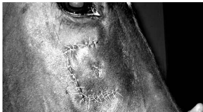
Zustand am 17. März 2007

Meine Stute wurde erfolgreich und ohne weitere Komplikationen operiert . Die ersten drei Tage war die Wunde noch mit einem Verband abgedeckt und sie bekam Unmengen von Medikamenten. Sie machte einen sehr benommenen Eindruck und zu dieser Zeit, war mir nur noch zum Heulen zumute. Jeden zweiten Tag wurde über das gebohrte Loch im Kiefer eine Eiterspülung gemacht.