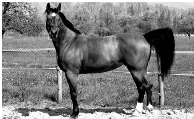
Ein Bild, welches mein Pferd bei vollster Gesundheit zeigt

Fallbericht einer Kundin: Ersten Begegnung mit der Homöopathie.